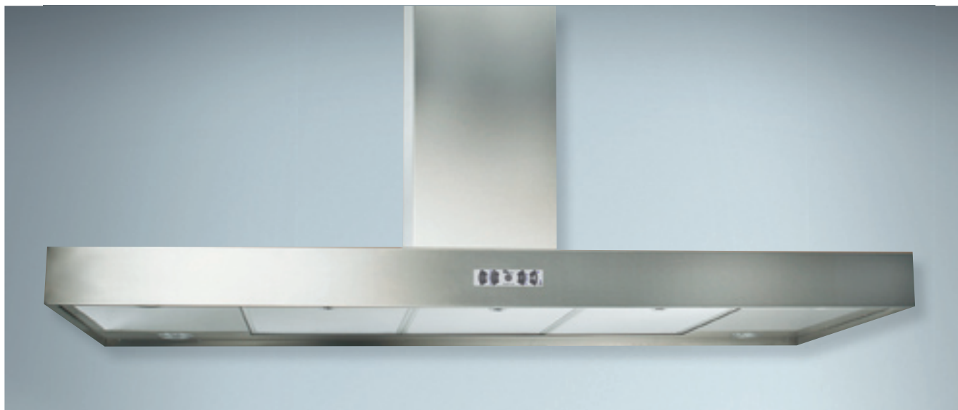
FOTOGRAFÍA: MODELO ISLA